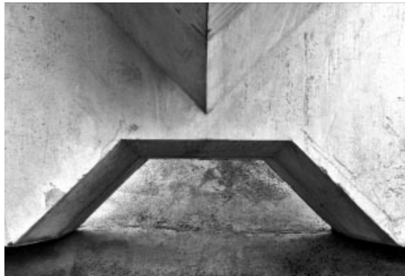
René van Rijswijk