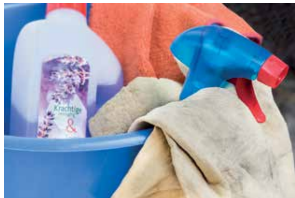
Augustus: Schoonmaak en Onderhoud Clubgebouw