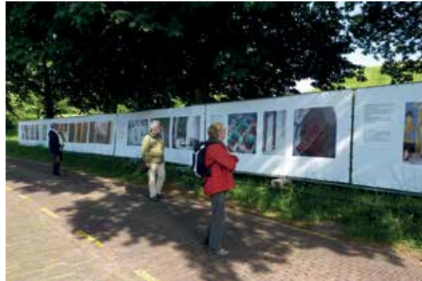
Juni: Bezoek FotoFestival Naarden